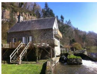
Gite du moulin de Pleines Œuvres Tessy-Bocage