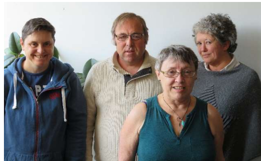
Les représentants 2019 de l'E.C.C de Granville

Au cours de l'année 2019, le Conseil d'Administration s'est réuni 4 fois. (7 février, 16 mai, 4 juin, 20 juin et le 7 novembre)