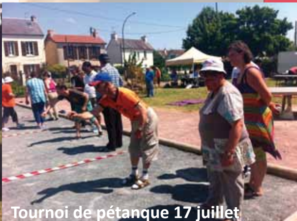
Tournoi de pétanque 17 juillet