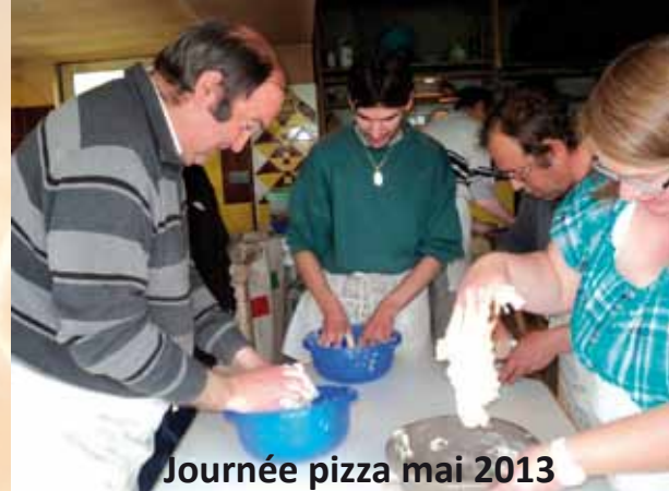
Journée pizza mai 2013