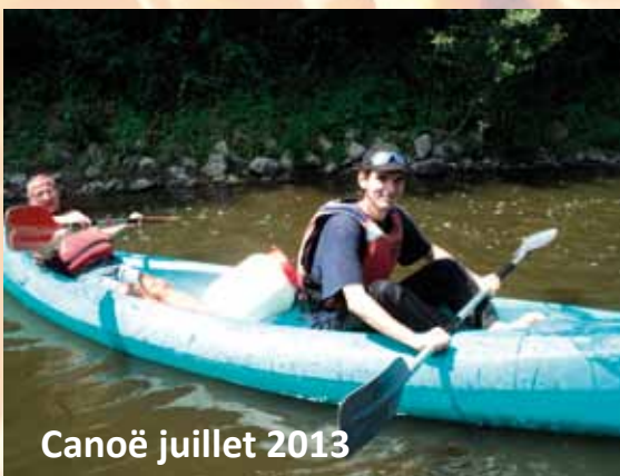
Canoë juillet 2013