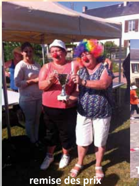
remise des prix