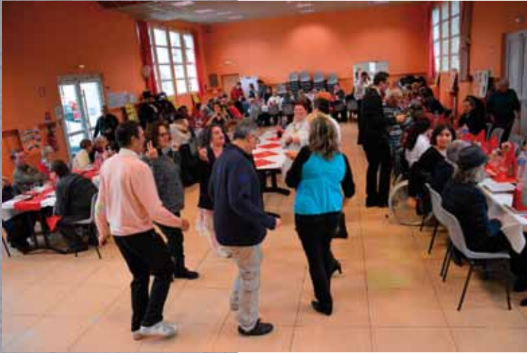
Les adhérents de l'association se sont déplacés de Caen, Vire et Granville afin de fêter Noël avec des habitants de Granville