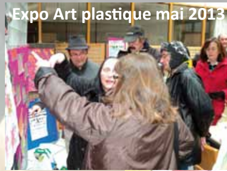
Expo Art plastique mai 2013