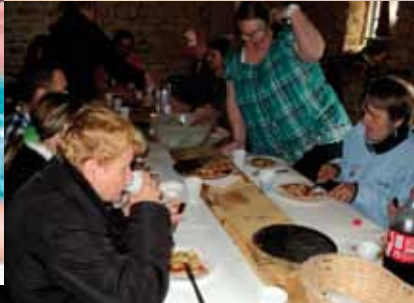
Avec la boulangerie «Les Copains»