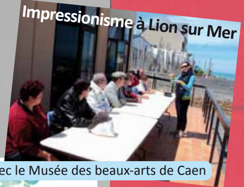
Impressionisme à Lion sur Mer