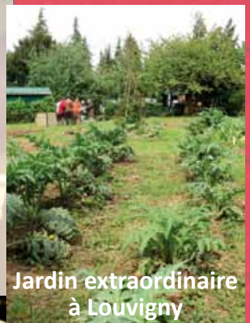
Jardin extraordinaire à Louvigny