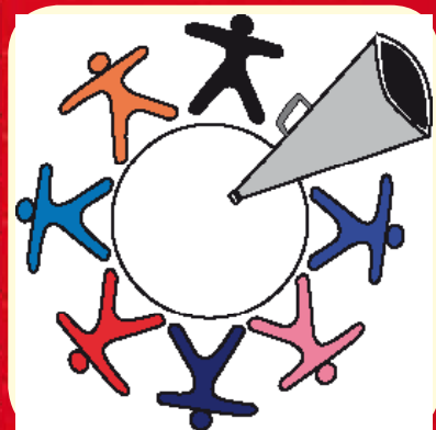
Association ADVOCACY- Basse-Normandie

Journal réalisé grâce au soutien de la ville de Caen Appel à projet 2013 «Santé Bien-être»