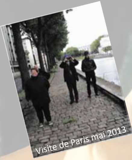
Visite de Paris mai 2013