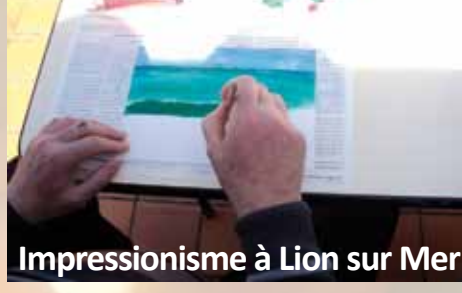
Impressionisme à Lion sur Mer